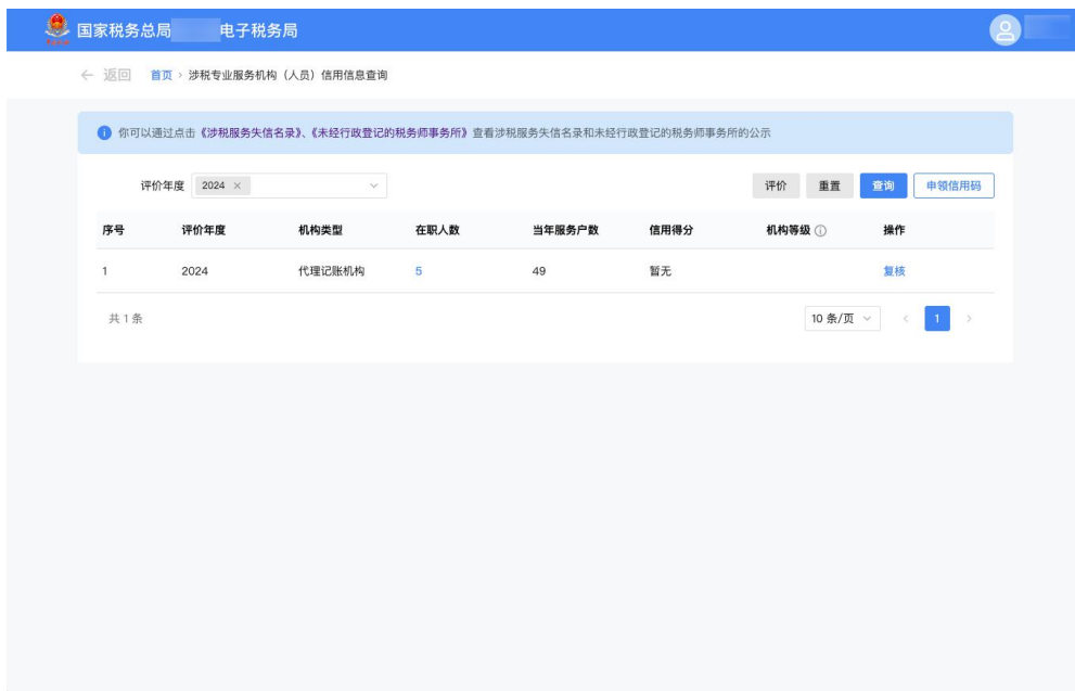
图 1 申领机构信用码入口

涉税专业服务机构通过企业登录的方式进入新电局后，按照涉税信息查询-涉税专业服务机构（人员）信用信息查询的菜单路径进入功能。