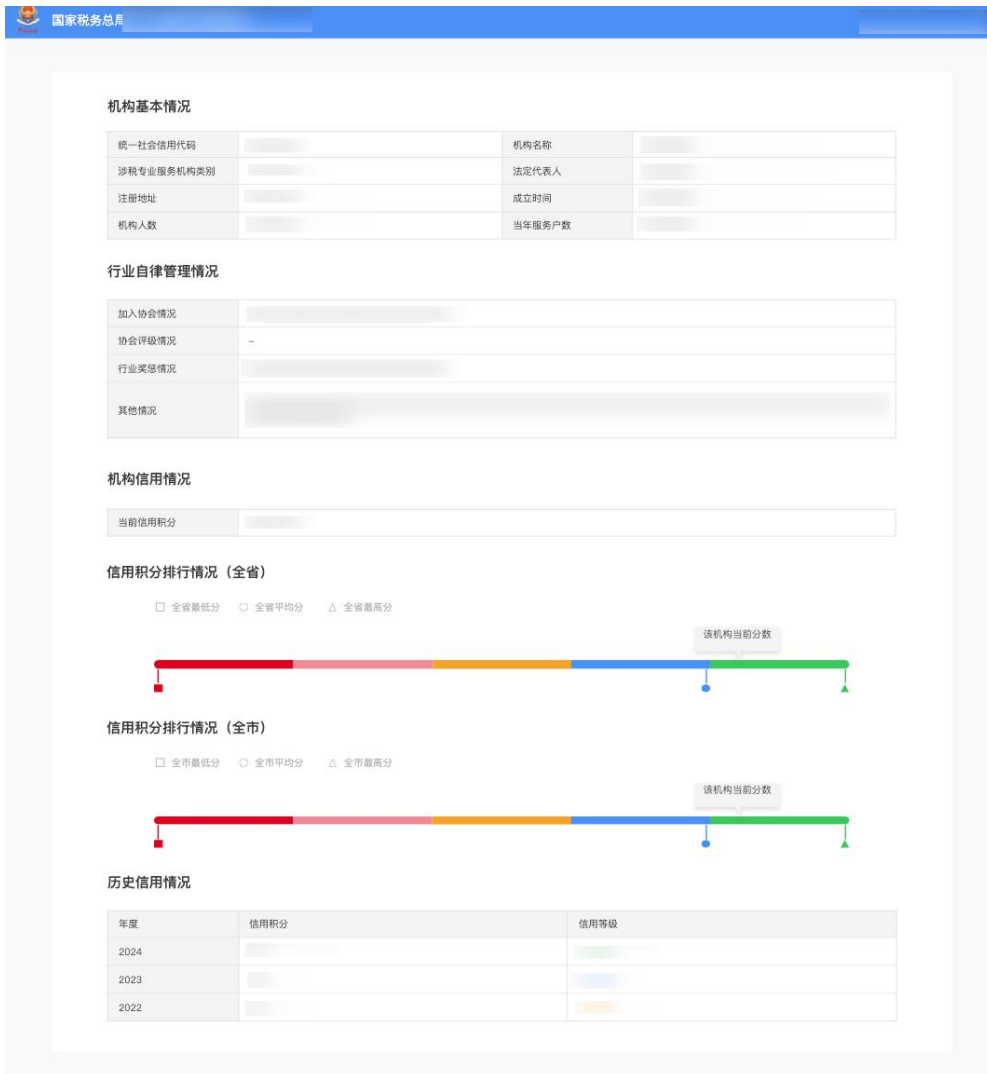
图 4 查看机构信用码详情