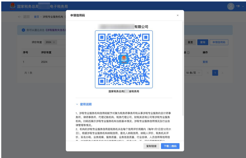
图 2 申领机构信用码弹窗