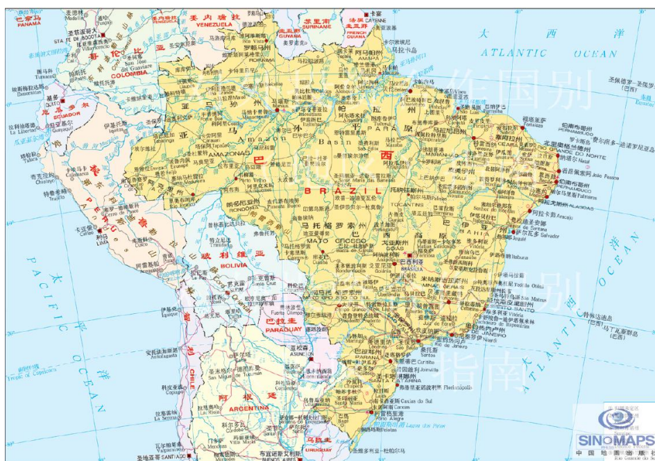
图 1 巴西地图

巴西国土面积 851.49 万平方公里，海岸线长约 7,400 公里。领海宽度为 12 海里，领海外专属经济区 188 海里。巴西全国共分 26 个州和 1 个联邦区。