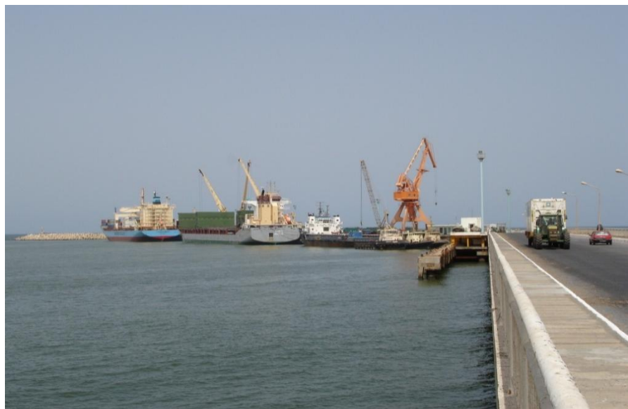
中国援建毛塔友谊港

毛塔有努瓦克肖特和努瓦迪布两个港口，年吞吐量1670万吨，其中努瓦克肖特友谊港350万吨，努瓦迪布港120万吨，工矿公司矿石码头1200万吨。有两家公司承担海运业务，分别是马士基（MAERSK）和寿格高（SOGEGO）。