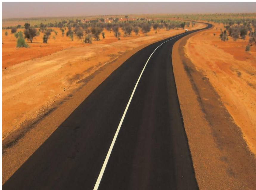
罗索—博盖公路2标段，全长94公里

毛塔唯一的一条铁路是祖埃拉特至努瓦迪布的国内铁路，承担将提里斯-宰穆尔省矿区铁矿砂运往努瓦迪布港口的运输任务。该线路运行列车车皮多达180节，堪称世界最长列车，日运行两次。铁路线全长675公里。视需要，有时挂一节客运车厢。每年运载5万名旅客、2.4万立方米的铁矿砂和近400头骆驼，并为沿途居民每周运送800立方米的水。