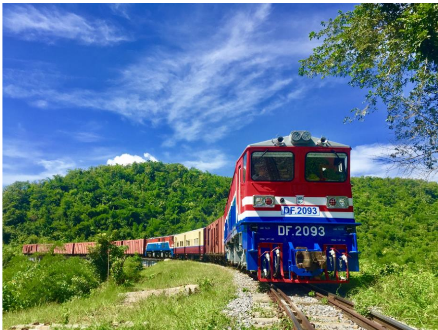
中国机械进出口（集团）有限公司与缅甸铁路总公司在内比都合建的机车厂总装厂组装的第一台机车上线负载运行

进行国事访问期间，中缅双方签署并交换了《中华人民共和国商务部与缅甸联邦共和国投资与对外经济关系部关于加强基础设施领域合作的谅解备忘录》，支持两国企业在项目规划、投融资、设计咨询、施工、安装调试、运营维护、技术服务、设备和建筑材料的生产、加工、估价、监管与供应等基础设施投资、建设和运营方面开展合作。