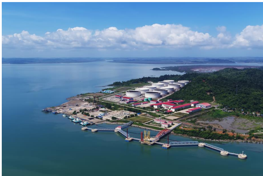
中缅油气管道马德岛港

【承包工程】据中国商务部统计，2019年中国企业在缅甸新签承包工程合同129份，新签合同额63.07亿美元，完成营业额18.63亿美元。累计派出各类劳务人员4061人，年末在缅甸劳务人员4745人。新签大型承包工程项目包括中兴通讯股份有限公司承建2018-2019年缅甸MPT JO运维服务产品竞标项目；中铁国际集团有限公司承建缅甸曼德勒产业新城基础设施项目；中国建筑集团有限公司承建缅甸仰光新天地项目（中南）等。