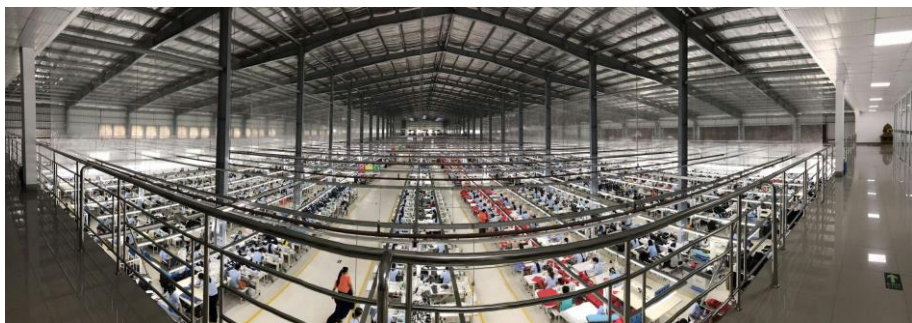
中资在缅纺织制衣厂

【能源】截至2018年过渡财年末，外国企业在缅甸石油和天然气领域投资留存项目88个，投资额185.45亿美元，占外商在缅甸投资的29.2%。据缅甸商务部统计，2018年过渡财年，缅甸天然气出口额11.7亿美金，约占缅甸出口总额的13.2%。中国石油（CNPC）、北方石油（NORTH PETRO）以及泰国的（PTTEPI）、韩国的大宇（DAEWOO）、法国的道达尔（TOTAL）、越南石油（PETRO VIETNAM）等公司都已与缅甸签署油气勘探开发区块协议。