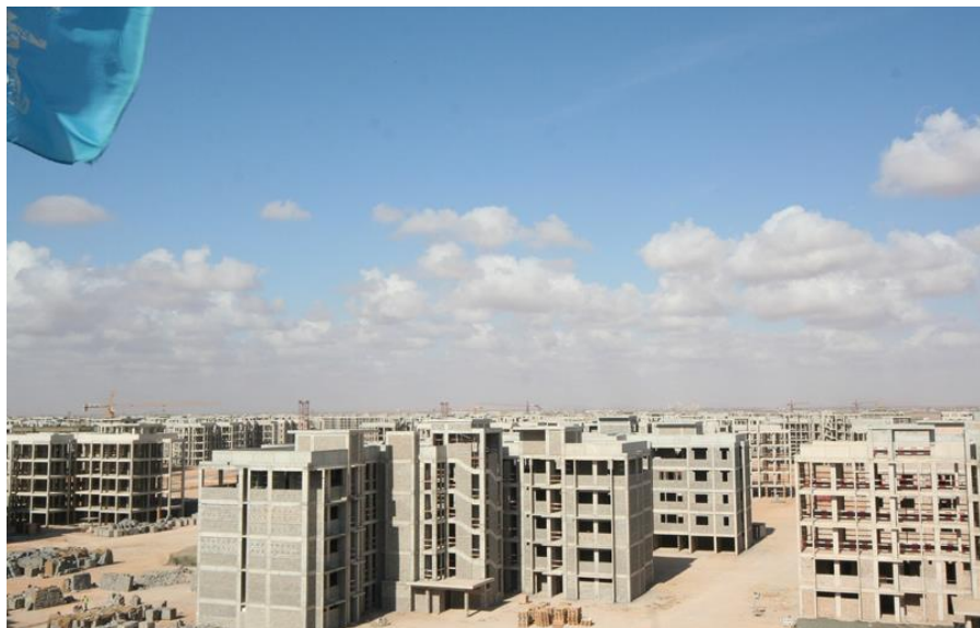
中建利比亚班加西富德15000套住宅工程施工现场

人员28人，年末在利比亚劳务人员70人。新签大型承包工程项目包括中兴通讯股份有限公司承建2017 Libya Libyana Manager Service Phase 5项目。