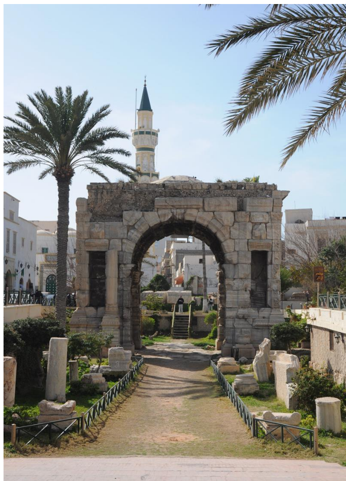
的黎波里市中心古城清真寺