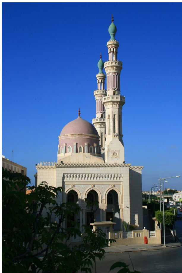
利比亚穆罕默德清真寺

伊斯兰教是国教。逊尼派穆斯林信众占96.6%，基督教占2.7%，佛教占0.3%。